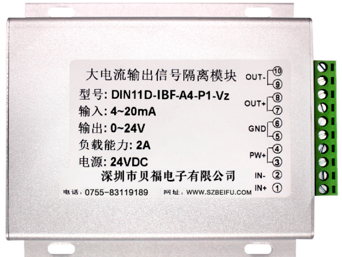
图 1 模块外观图